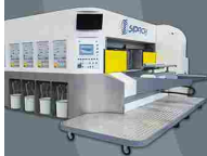
ROYAL VB DD CASEMAKER Macchina stampa dal basso Bottom-printing machine

la migliore tecnologia italiana per il converting